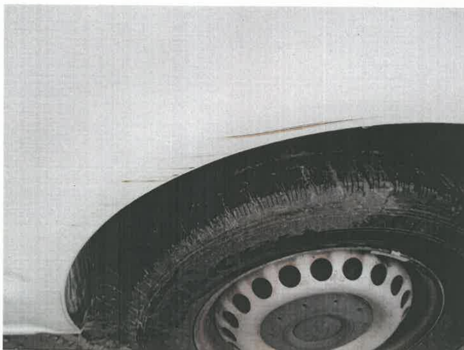
Bild 10 : Gebrauchsspuren innen und außen dem Alter und Einsatzzweck entsprechend vorhanden