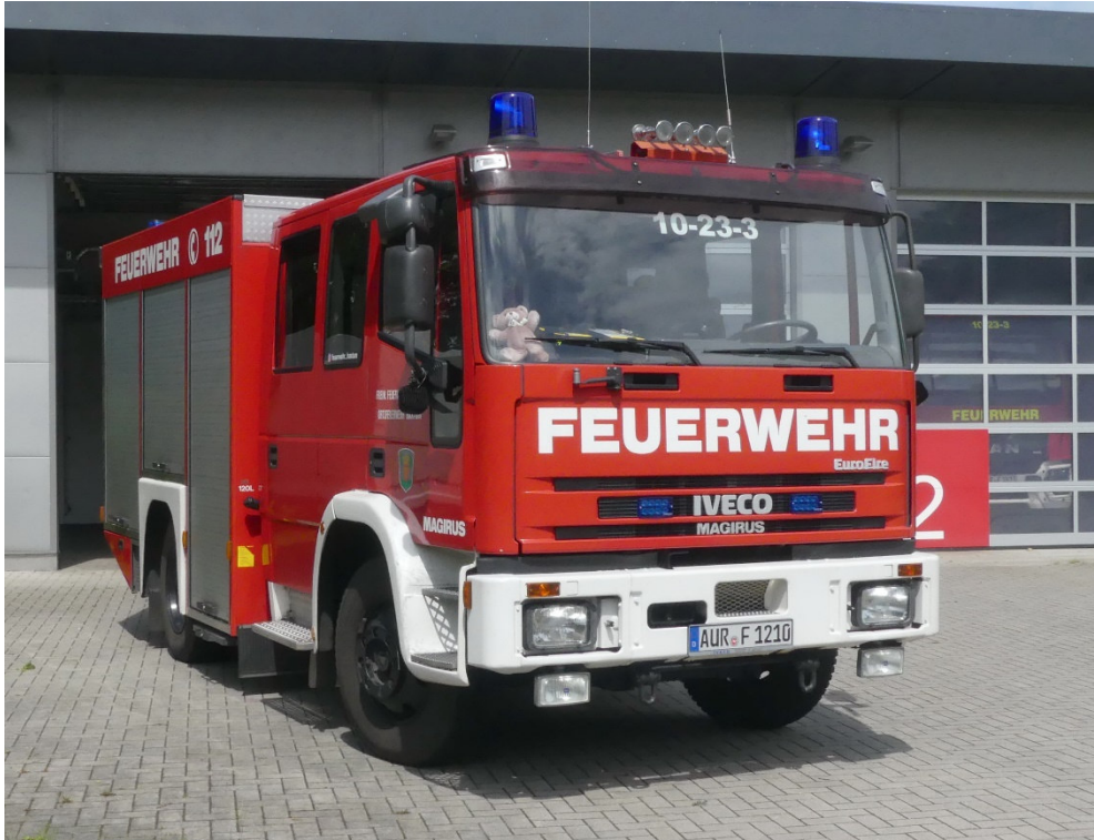
Lichtbild Nr. 3