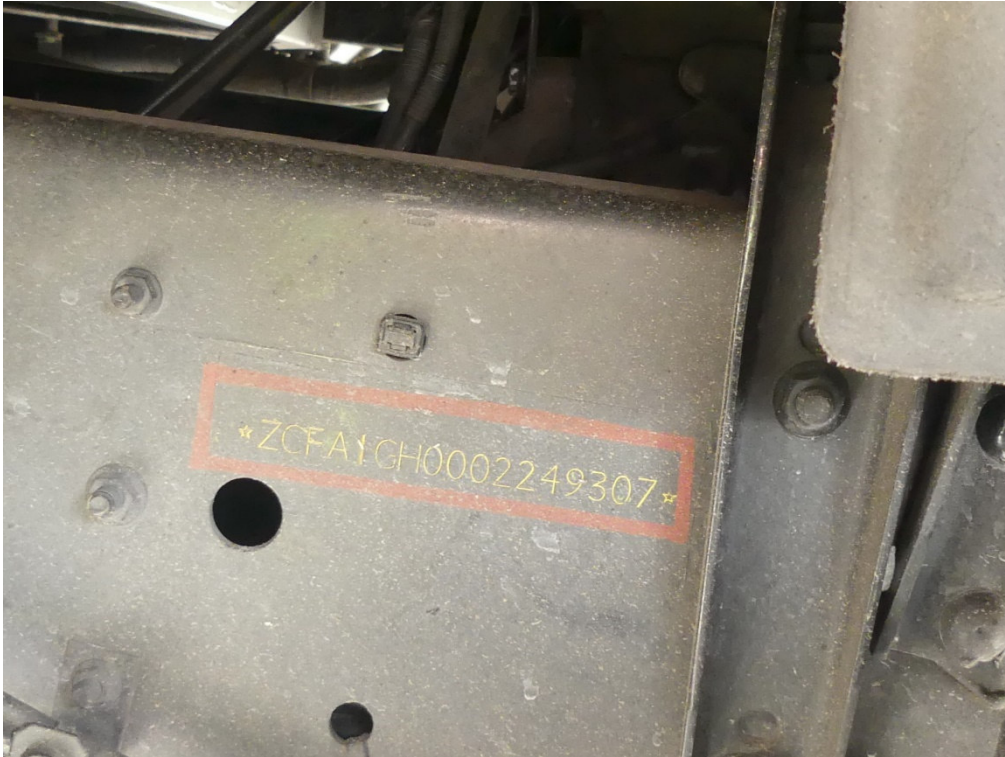
Lichtbild Nr. 11