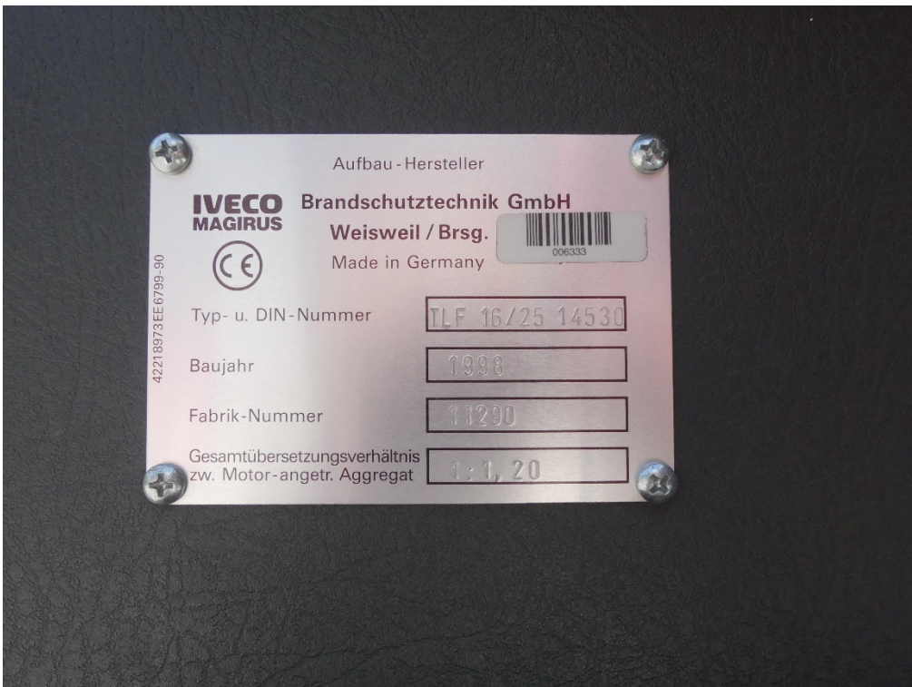
Lichtbild Nr. 10