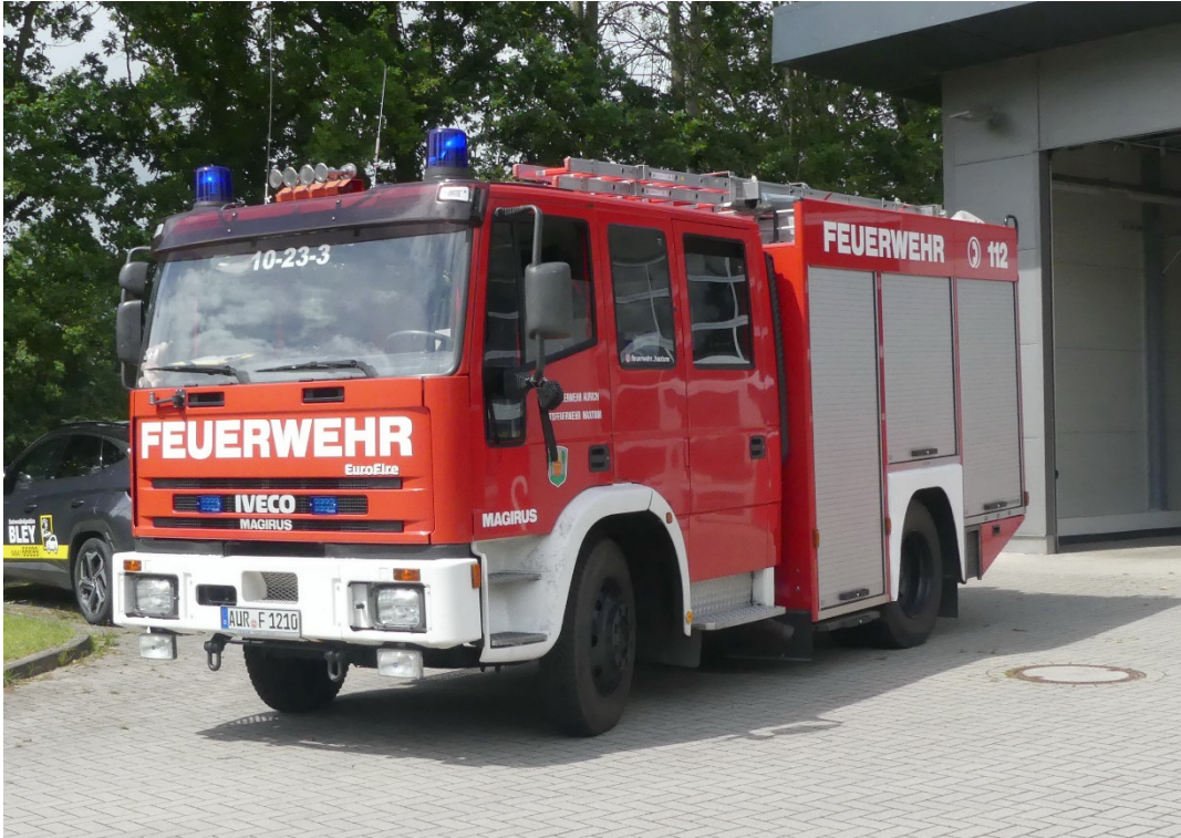
Lichtbild Nr. 1