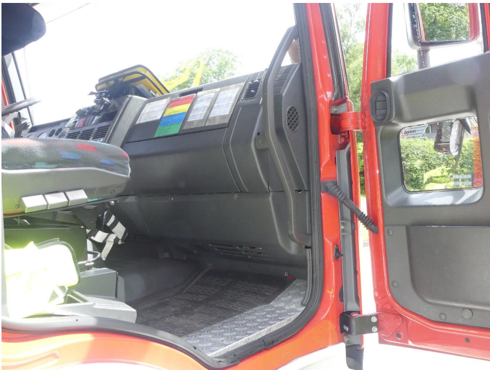
Lichtbild Nr. 6