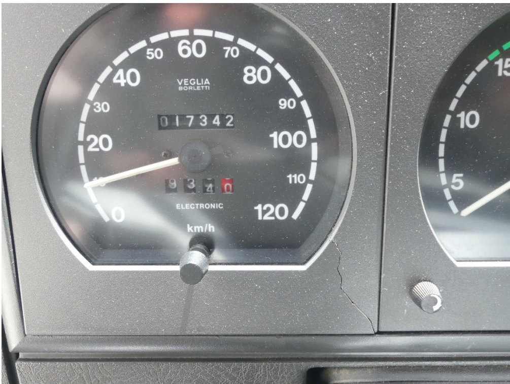
Lichtbild Nr. 12