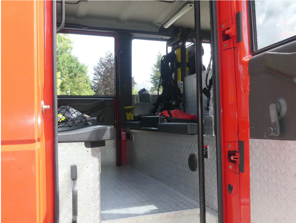
Lichtbild Nr. 7