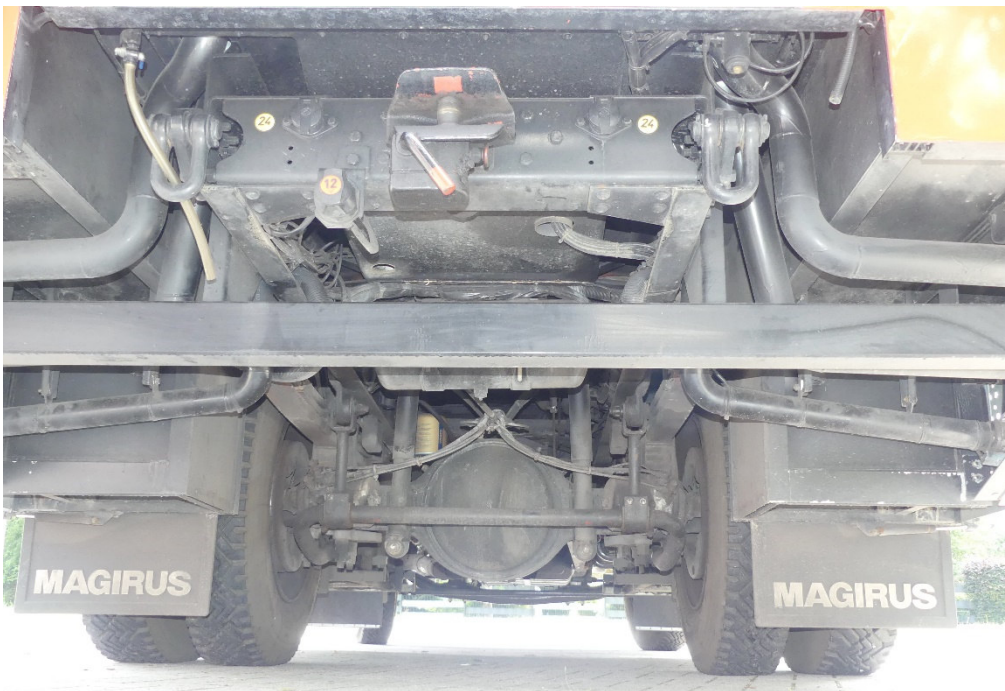
Lichtbild Nr. 8