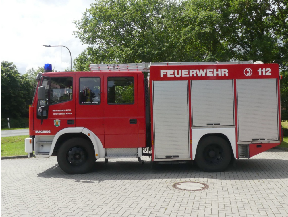
Lichtbild Nr. 5