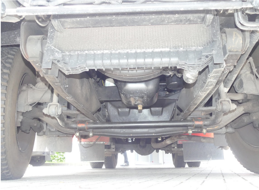
Lichtbild Nr. 9