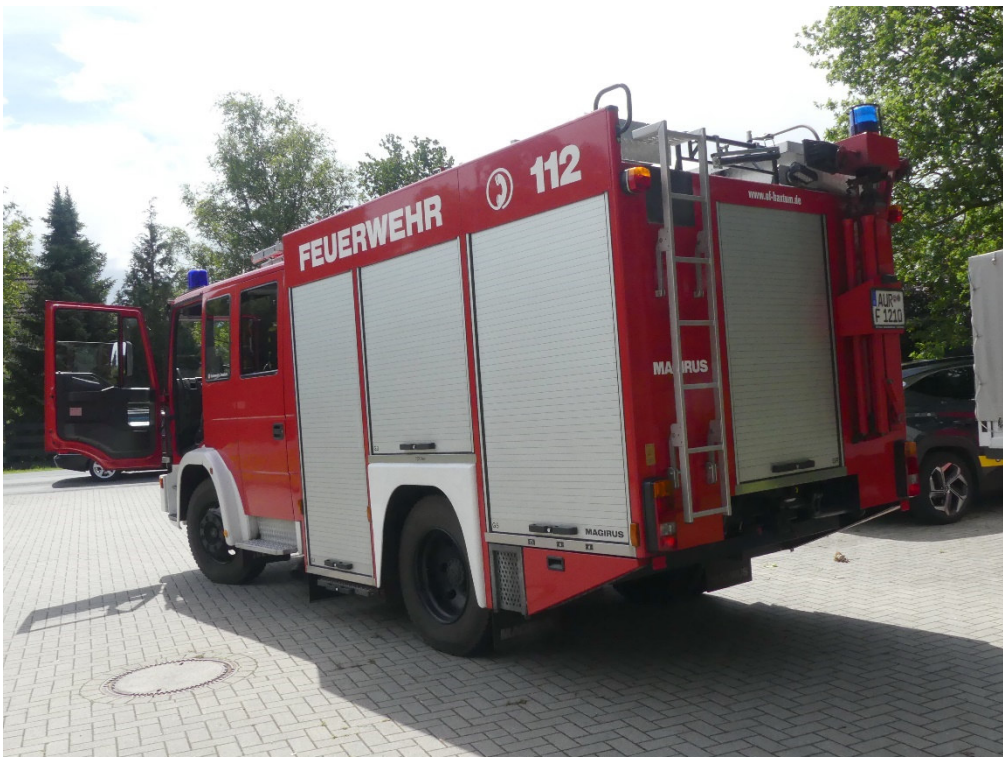
Lichtbild Nr. 4