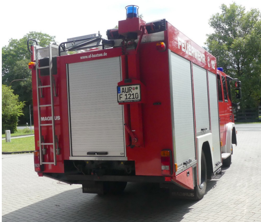
Lichtbild Nr. 2