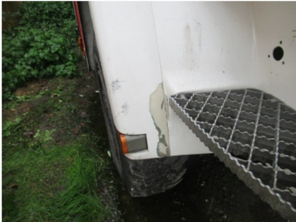
Bild 28 : Kotflügel vorne rechts gebrochen Einstiegsleuchte rechts fehlt