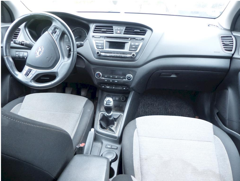
Bild 3, wegen fehlender Fahrzeugschlüssel Tachostand nicht ablesbar