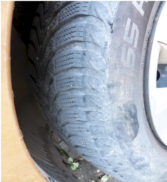
Bild 10, alle Winterreifen abgefahren