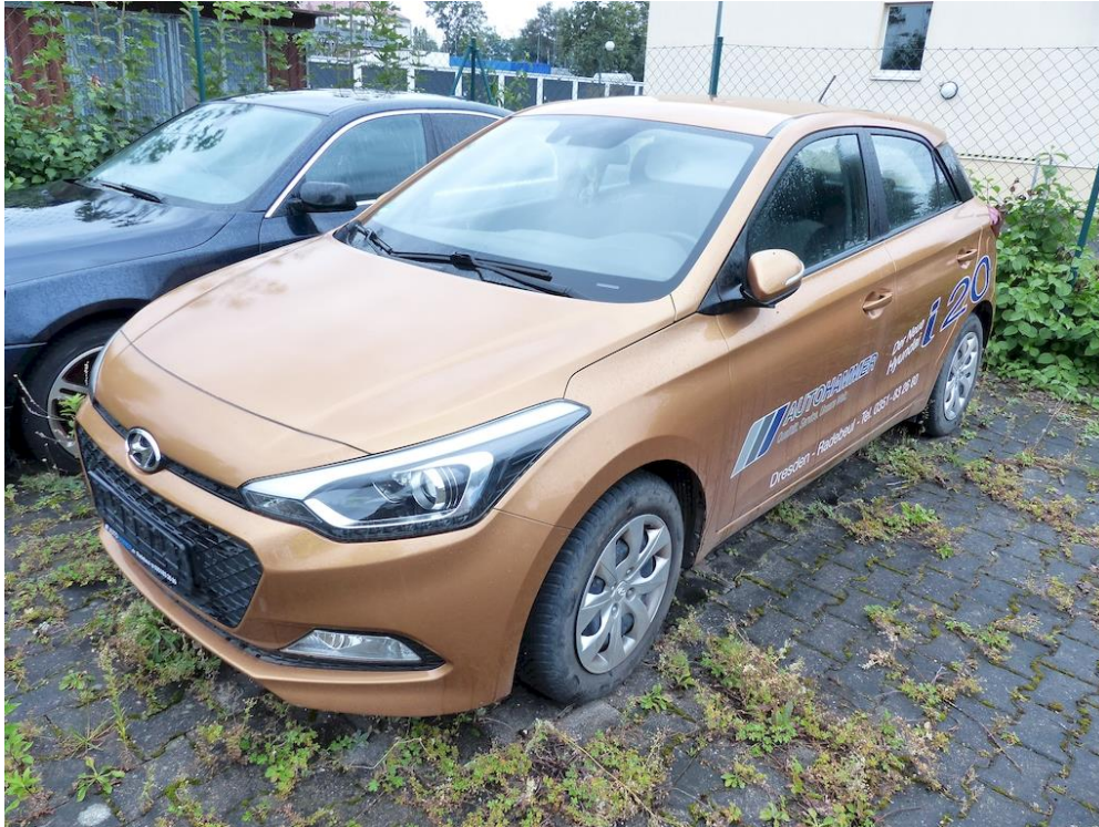
Bild 1, Ansicht vorn links