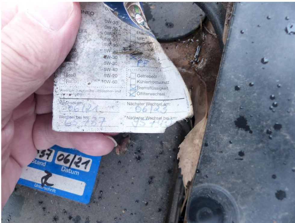
Bild 8, letzter Ölwechsel bei 65.737 km in 06.2021