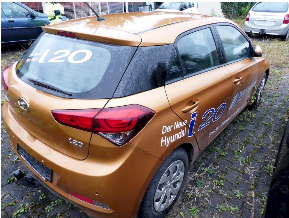
Bild 2, Ansicht hinten rechts