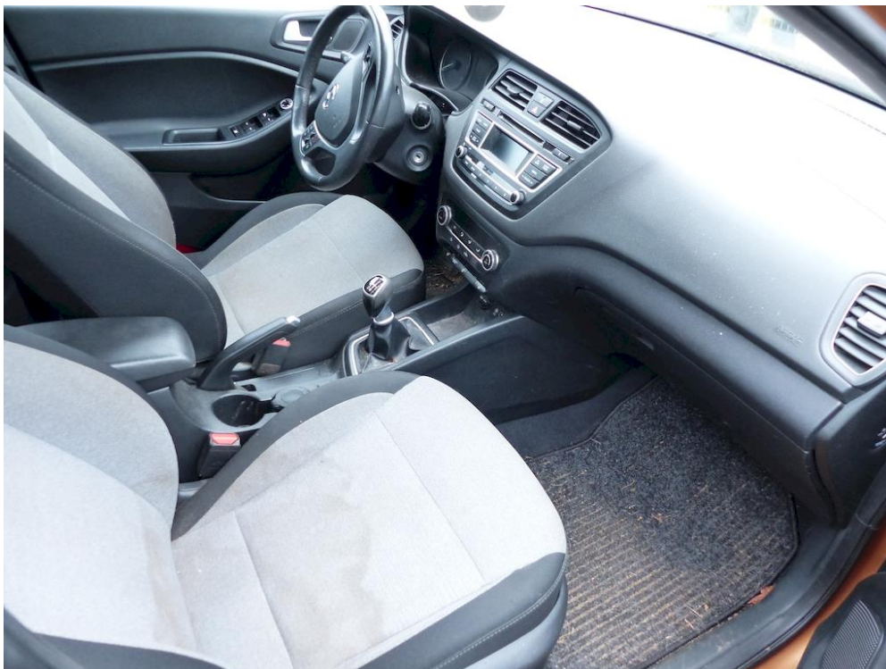
Bild 6, Sitzpolster stark verschmutzt