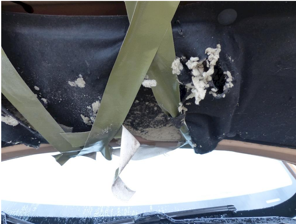
Bild 9, Dämmatte Motorhaube beschädigt

Lichtbildanlage GA-Nr. GA-Nr. N.511.1816.937