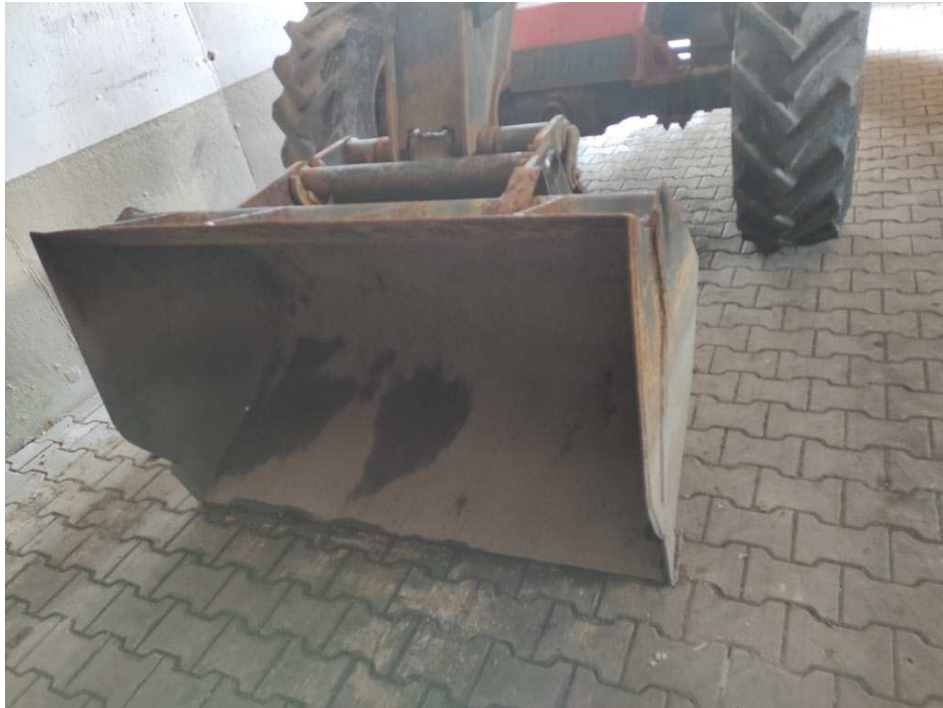
Bild 9 Zweitschaufel