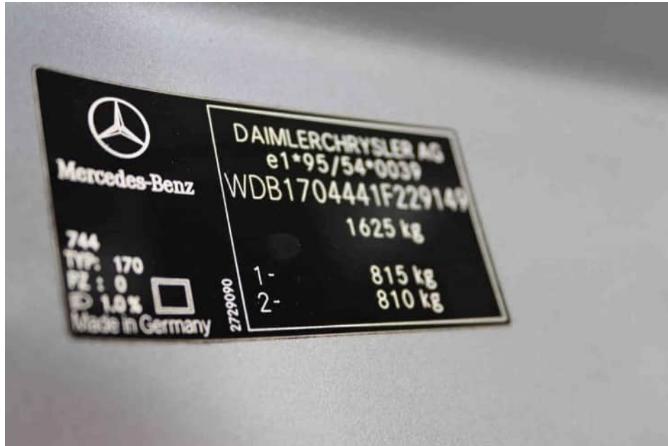
Bild 47 Fahrzeug-Ident-Nummer