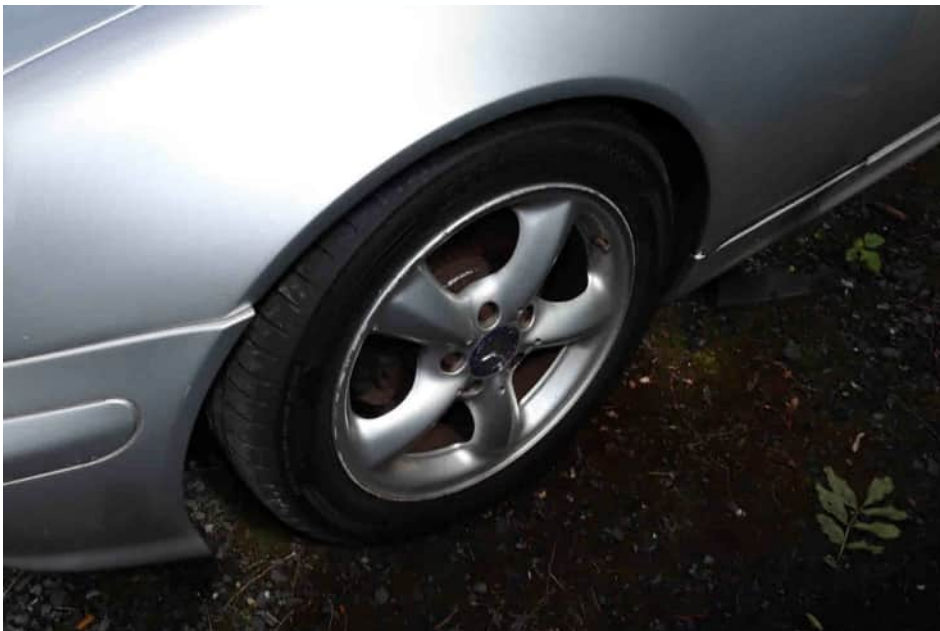
Bild 22 Rad vorne links