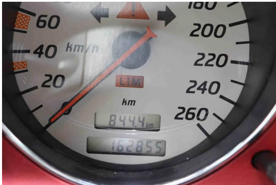
Bild 17 Kilometerstand zum Besichtigungszeitpunkt