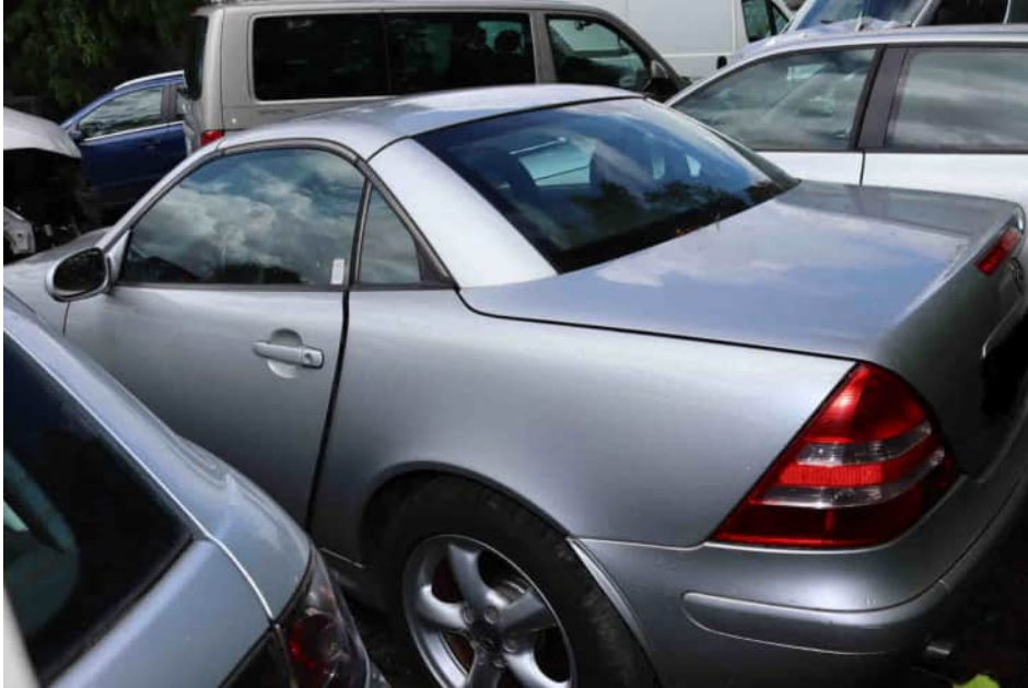
Bild 3 Diagonalansicht hinten links