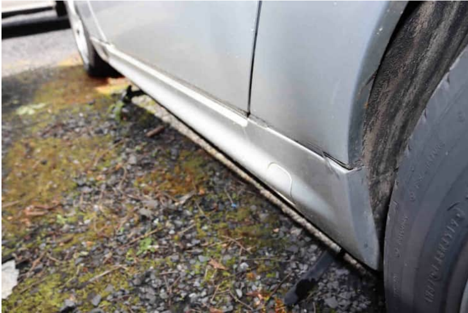
Bild 29 Lose Schwellerverkleidung links