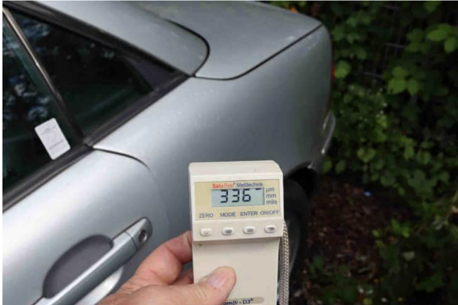
Bild 5 Nachlackierte Seitenwand links