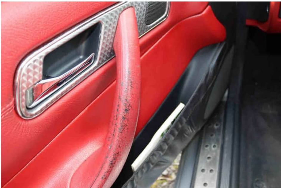
Bild 38 Abgenutzte Zuziehilfe links