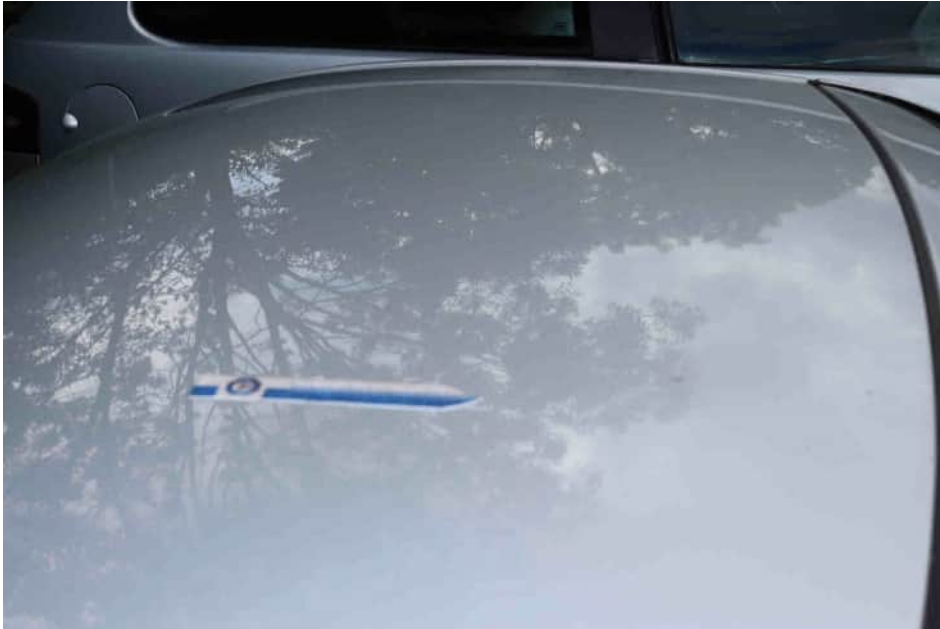
Bild 43 Lackbeschädigung Dach