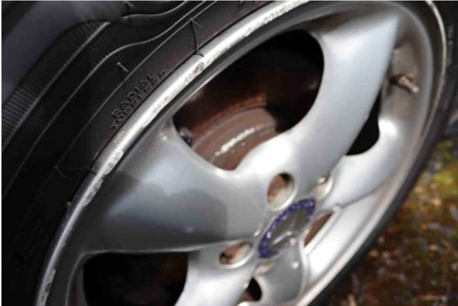
Bild 23 Verschürfte Felge vorne links