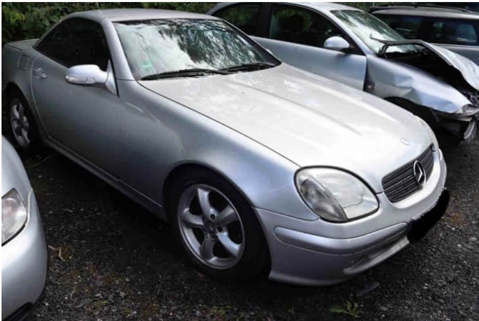
Bild 2 Diagonalansicht vorne rechts