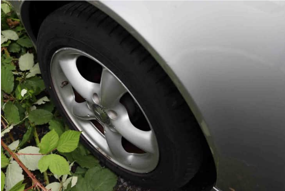
Bild 45 Rad hinten rechts