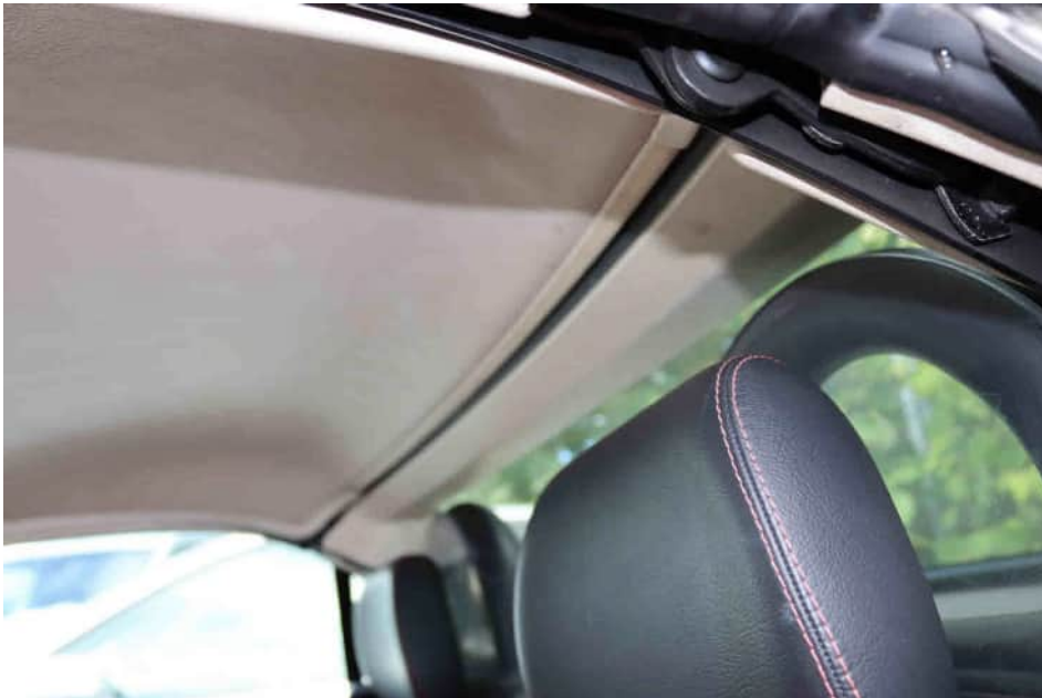
Bild 10 Innenraum