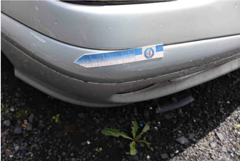
Bild 25 Verschürfter Frontstoßfänger