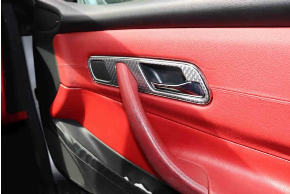
Bild 37 Abgenutzte Zuziehilfe rechts