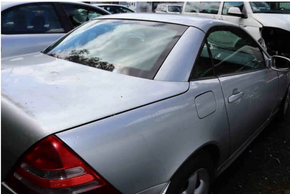
Bild 4 Diagonalansicht hinten rechts