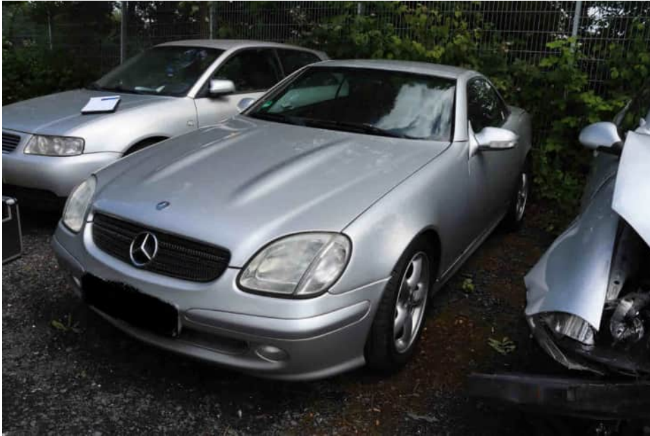
Bild 1 Diagonalansicht vorne links