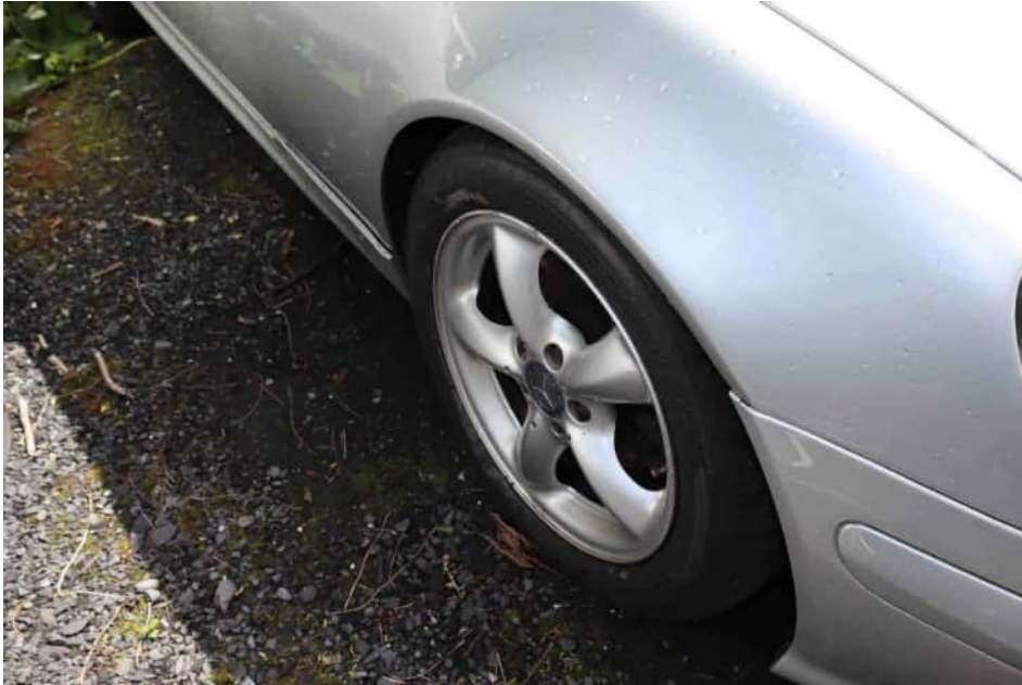
Bild 27 Rad vorne rechts