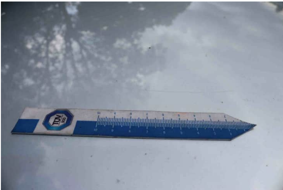
Bild 44 Lackbeschädigung Dach