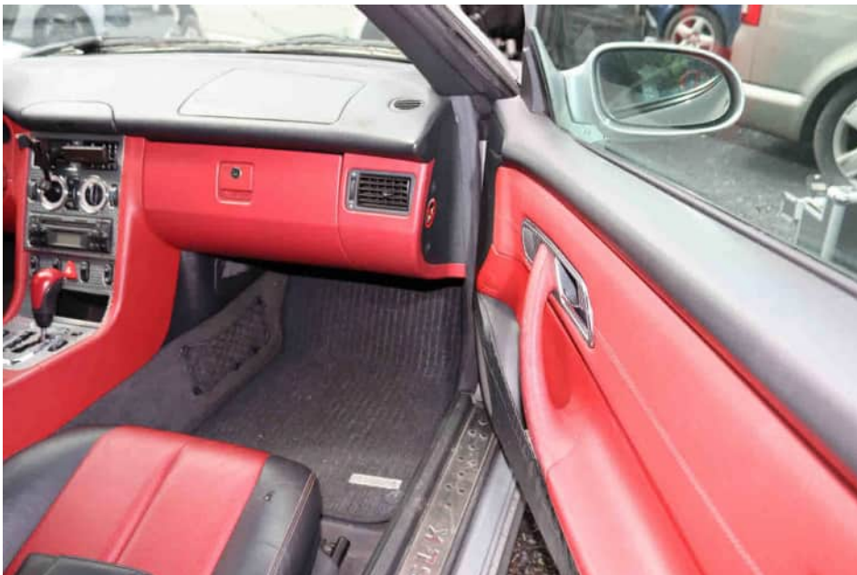
Bild 8 Innenraum