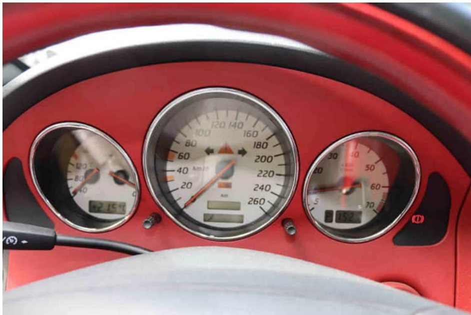
Bild 14 Kombiinstrument