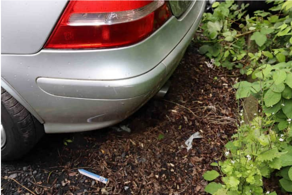
Bild 33 Lackschaden Heckstoßfänger