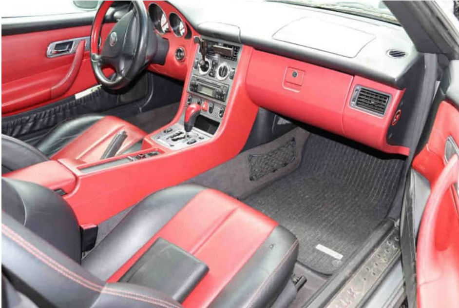
Bild 9 Innenraum