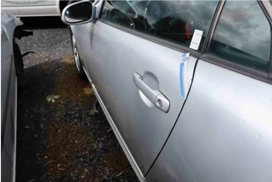
Bild 31 Lackschaden Tür links