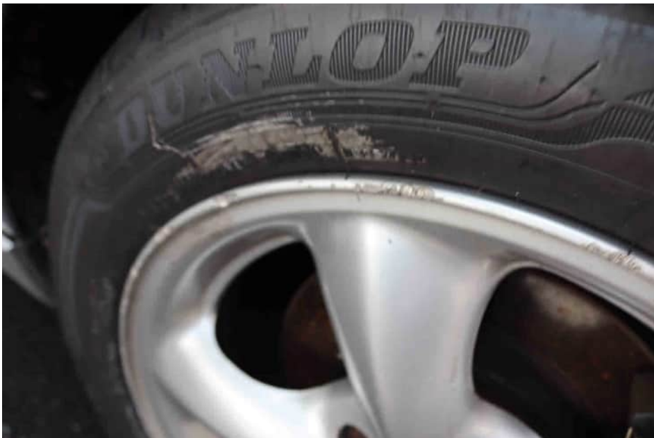
Bild 28 Verschürfte Felge vorne rechts