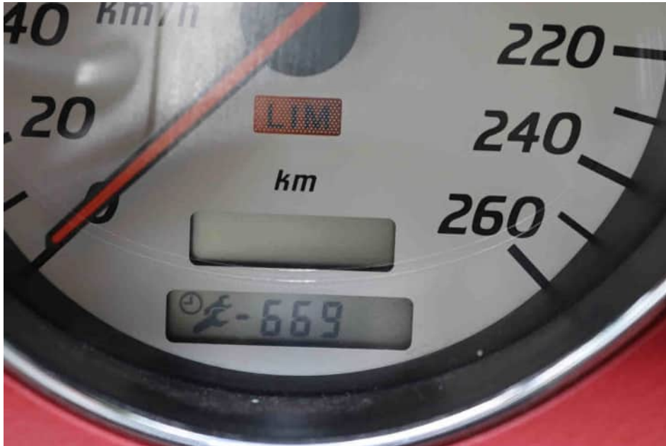
Bild 19 Kilometerstand zum Besichtigungszeitpunkt Service seit 699 Tagen fällig