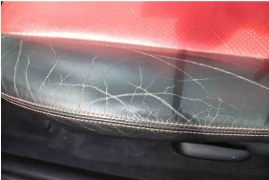
Bild 40 Beschädigter Sitzbezug links