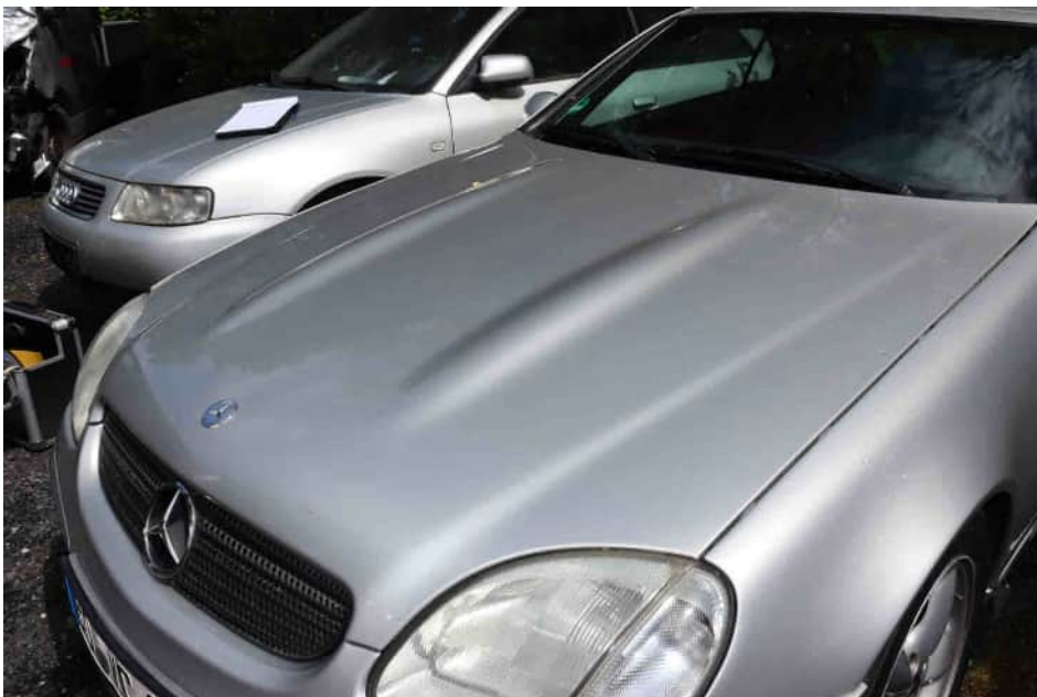
Bild 20 Verkratzte Motorhaube