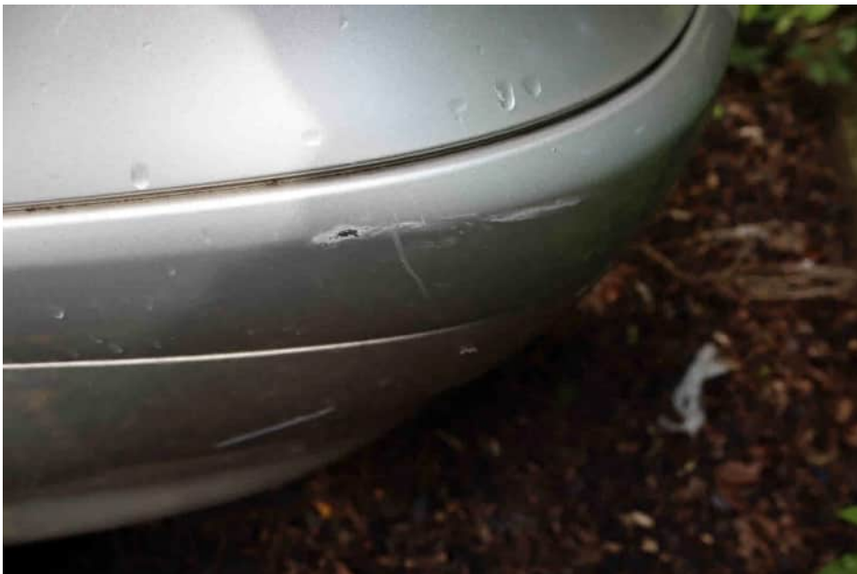
Bild 34 Lackschaden Heckstoßfänger