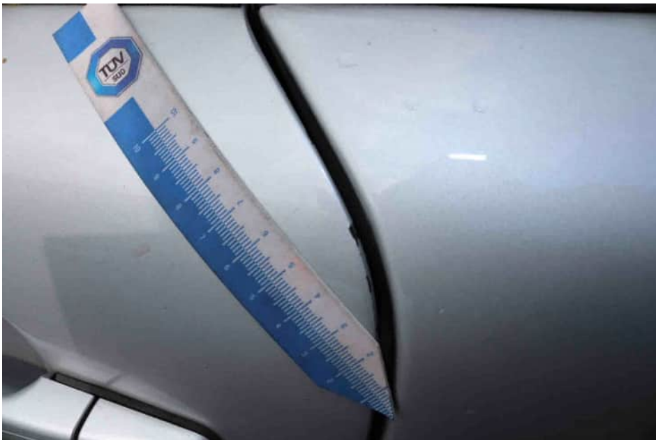
Bild 32 Lackschaden Tür links