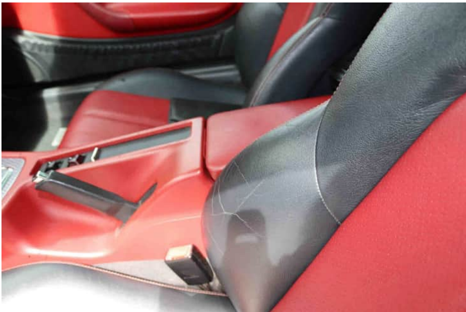
Bild 42 Beschädigter Sitzbezug links