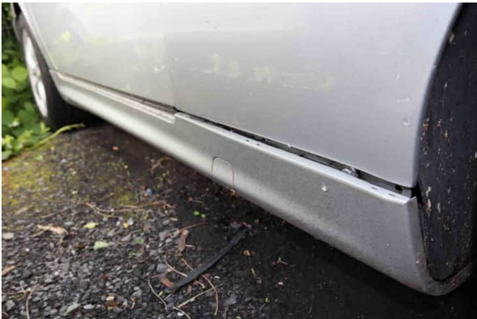
Bild 30 Lose Schwellerverkleidung links