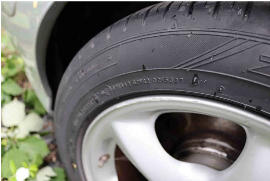
Bild 46 Verschürfte Felge hinten rechts