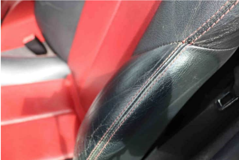
Bild 41 Beschädigter Sitzbezug links