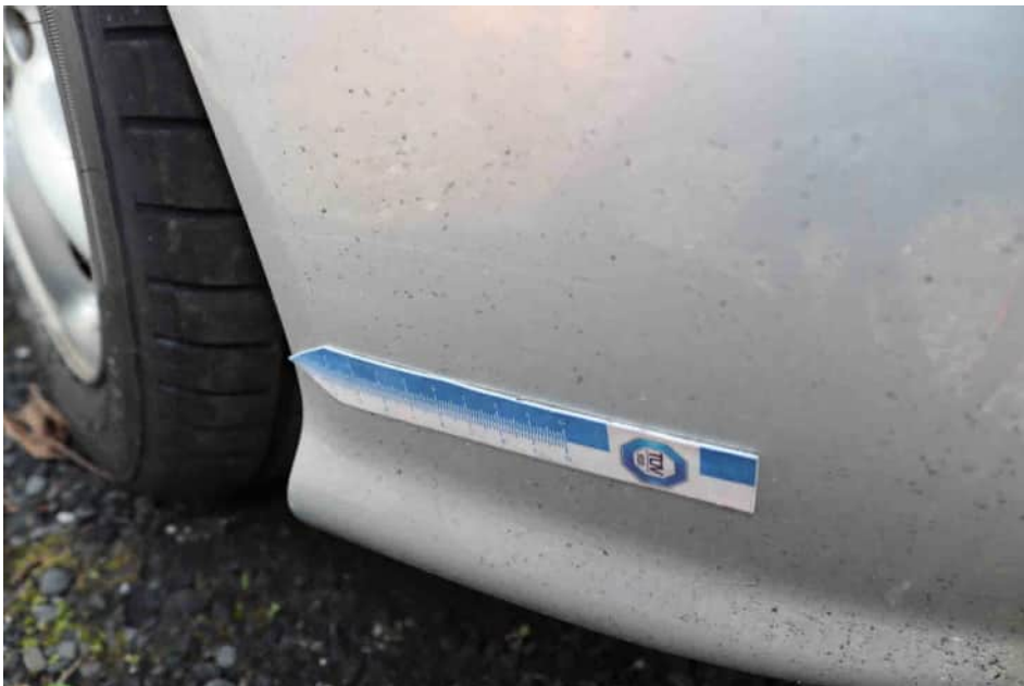
Bild 26 Verschürfter Frontstoßfänger