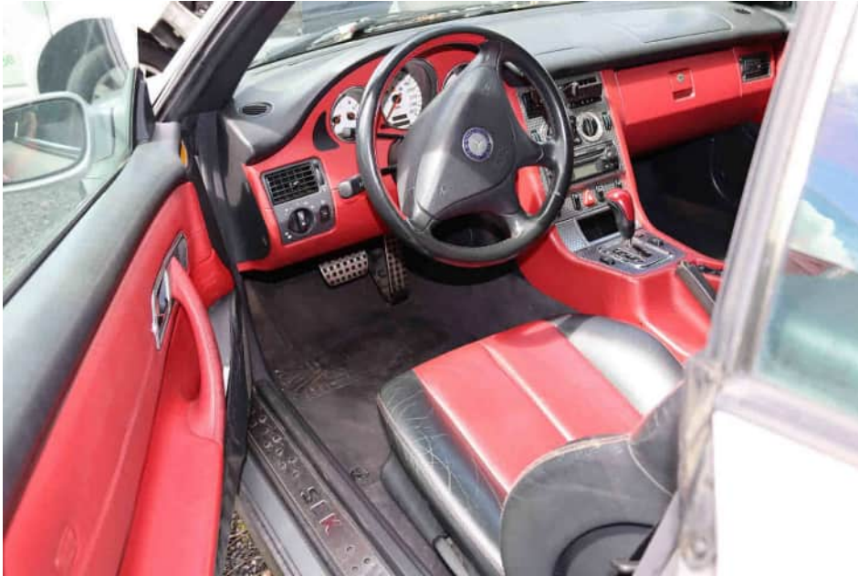
Bild 7 Innenraum