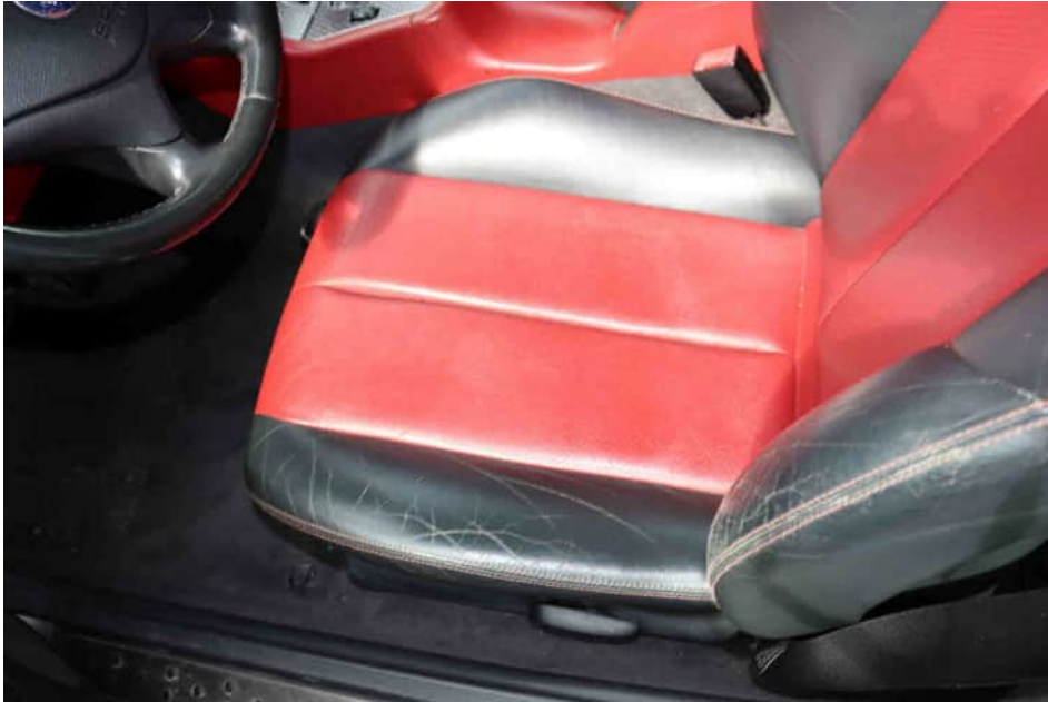
Bild 39 Sitz links