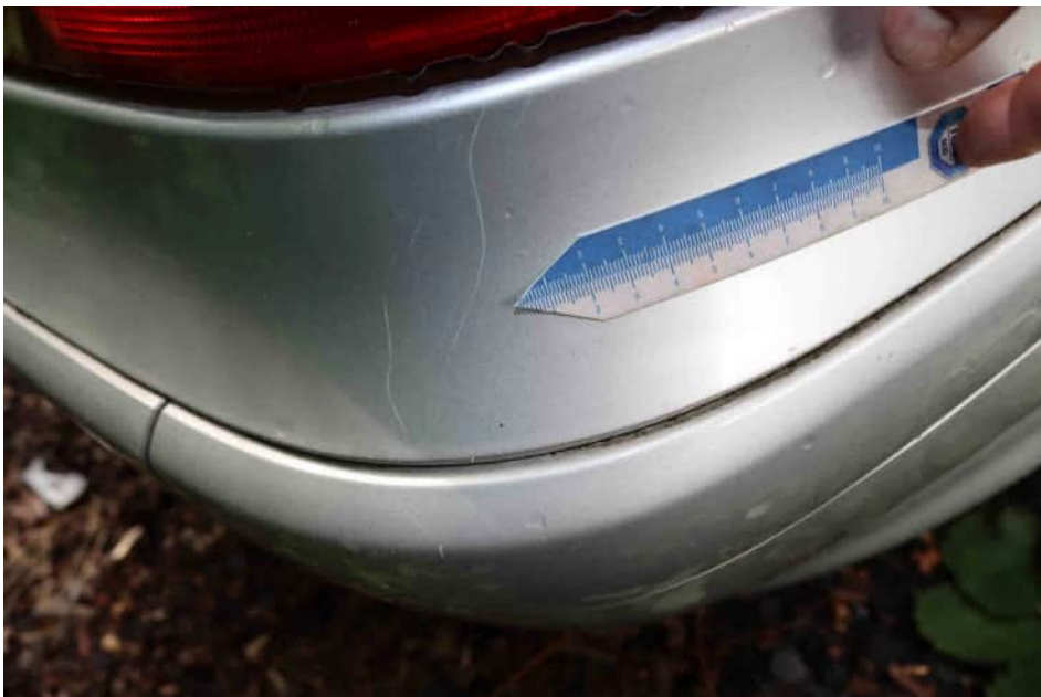
Bild 36 Lackschaden Heckstoßfänger