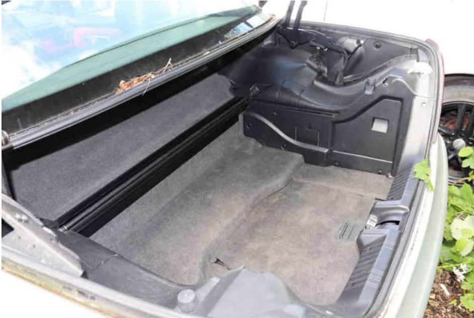
Bild 11 Kofferraum