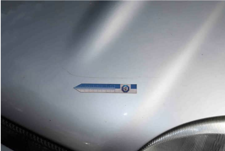
Bild 21 Verkratzte Motorhaube