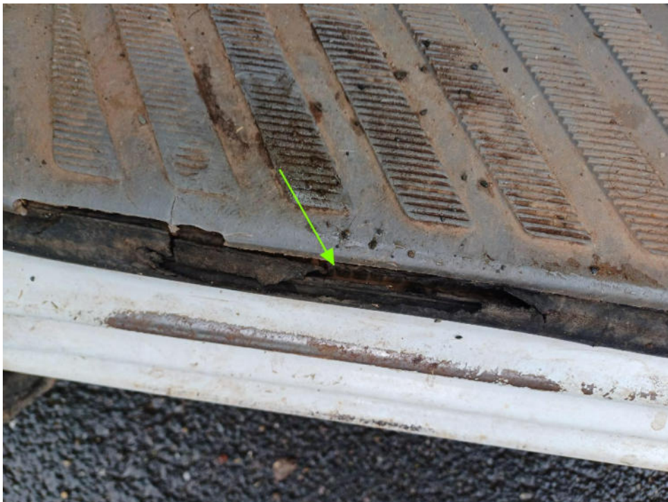
Bild 12 : Tür vorne links, Türdichtung gerissen/ Einstiegkasten gebrochen