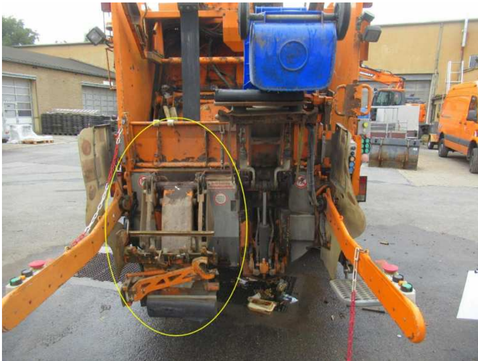
Bild 12 : Lifter an mehreren Stellen deformiert Lifter links ohne Funktion