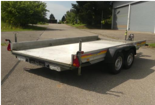
Ansicht hinten rechts