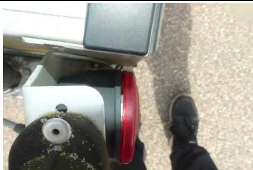
Rücklicht links gebrochen