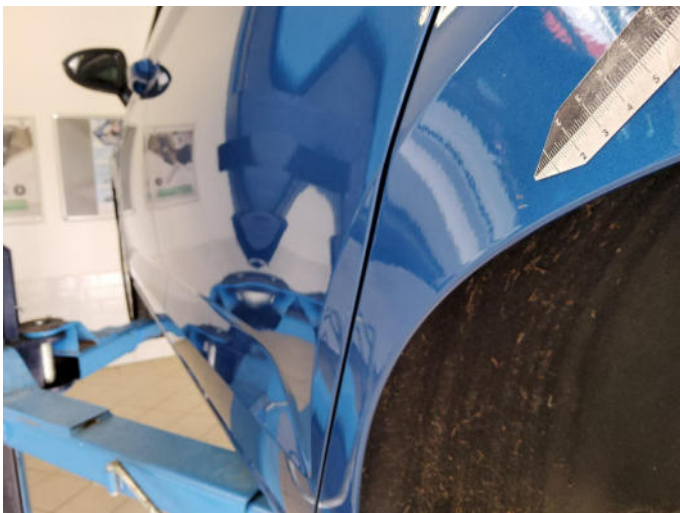
Bild 3: Außen, Seitenteil hinten links - Lackierung, Steinschlag, Gebrauchsspur