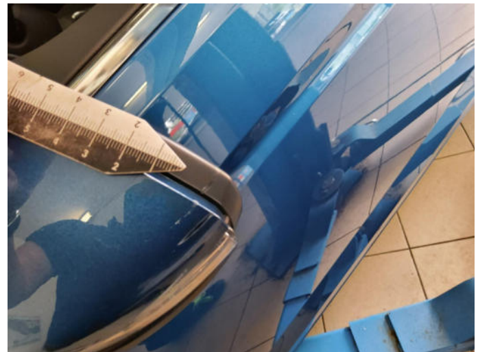
Bild 2: Außen, Außenspiegel links - Rahmen, verschrommt, erneuern