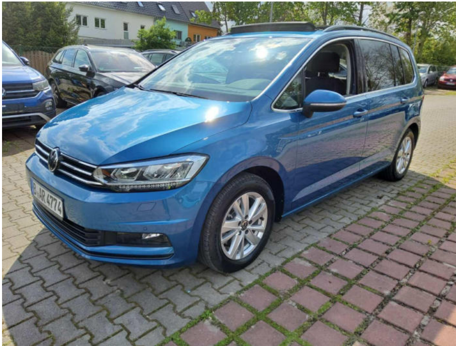
Übersichtsbild vorne links