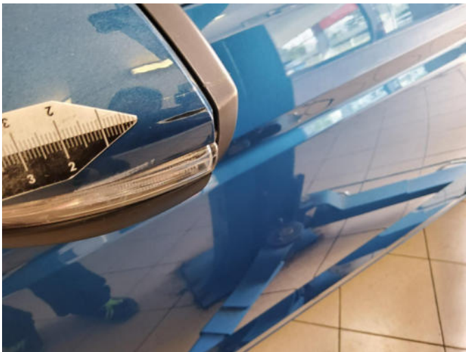
Bild 1: Außen, Außenspiegel links - Lackierung, verschrommt, lackieren mit Lackaufbau