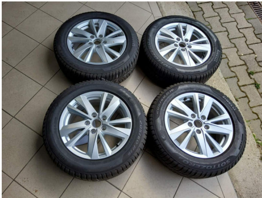
Zusätzlicher Radsatz Winter