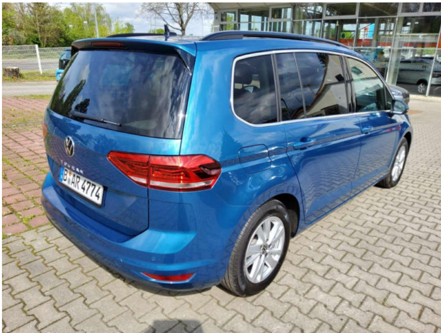
Übersichtsbild hinten rechts