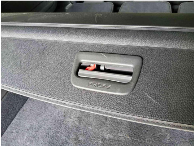
Bild 5: Innen, Kofferraum / Laderaum - Laderaumabdeckung, zerkratzt, keine Maßnahme