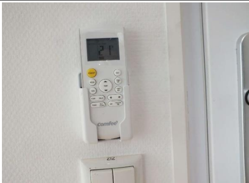
Ansicht Steuerung Klimasplitgerät