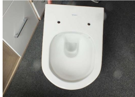
Toilette wird noch montiert