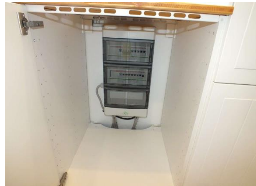
Ansicht Strom-Absicherung und -Verteilung