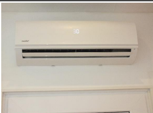
Ansicht Ausströmer Klimasplitgerät