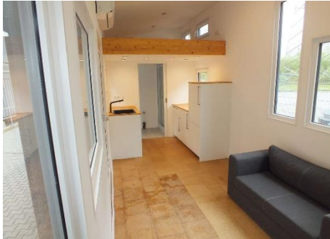
Ansicht Bett mit Küche