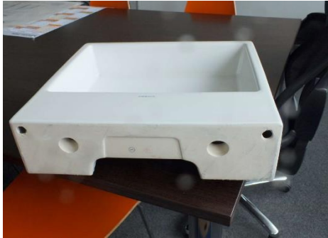
Waschbecken wird noch montiert