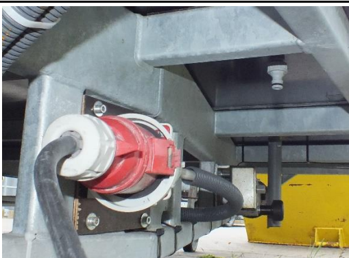
Ansicht Anschluß Strom- und Wasserversorgung