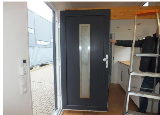
Ansicht Eingangsbereich mit Haustür