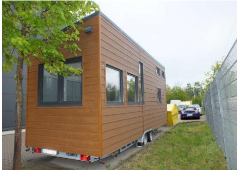
Ansicht hinten rechts