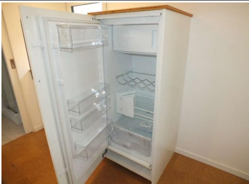
Ansicht Kühlschrank mit Gefrierfach