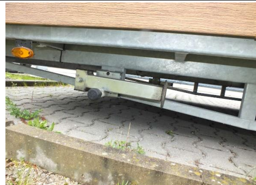
Ansicht Fallstütze (4x)