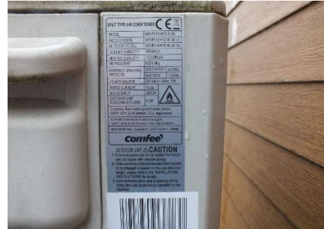
Ansicht Typschild Klimasplitgerät