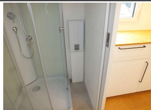
Ansicht Wasser-Duchlauferhitzer mit Boiler