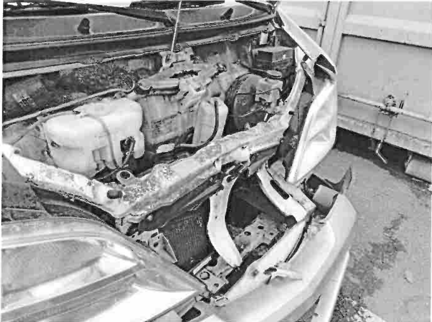
Bild 7: Schlossträger vorne deformiert, Bremskraftverstärker angestoßen, Kühlerpaket deformiert

Dokument 1447679 Fahrzeug-Kennzeichen N-HD103 Fahrzeug-Ident.-Nr. LVFBAFBC6CH101566 Die Lichtbildanlage enthält 17 Fotos