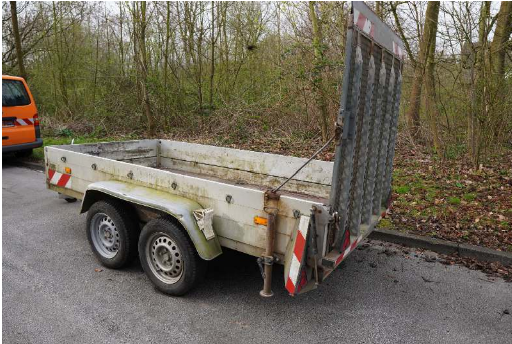
Übersichtsaufnahme von hinten links