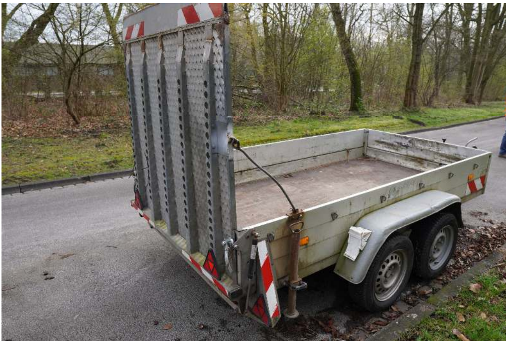
Übersichtsaufnahme von hinten rechts