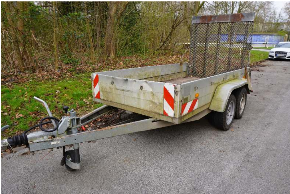
Übersichtsaufnahme von vorne links