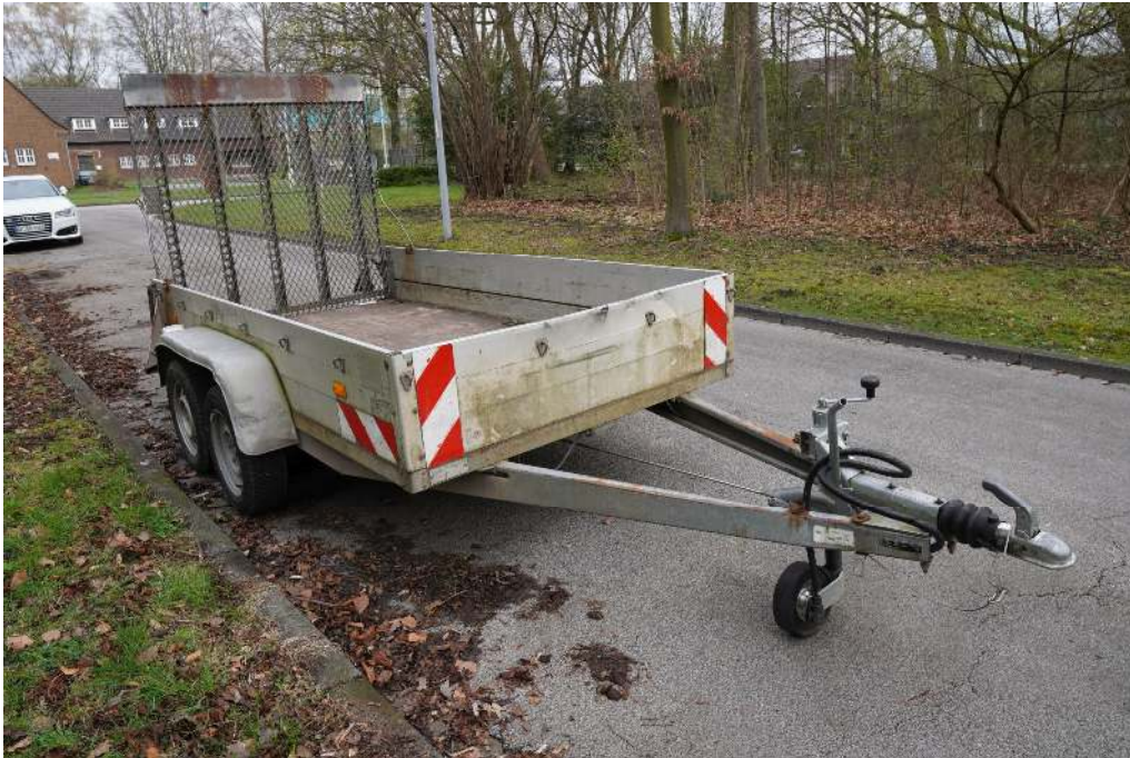
Übersichtsaufnahme von vorne rechts