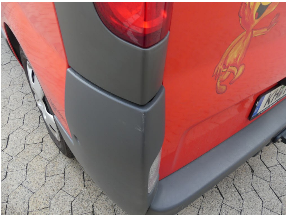
Bild 20 Altschaden