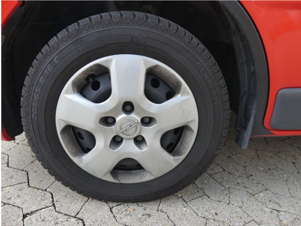
Bild 13 Rad-/Reifenkombination Vorderachse