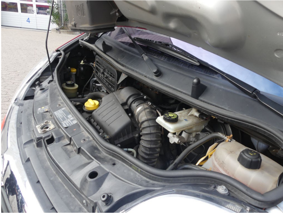
Bild 7 Motorraum