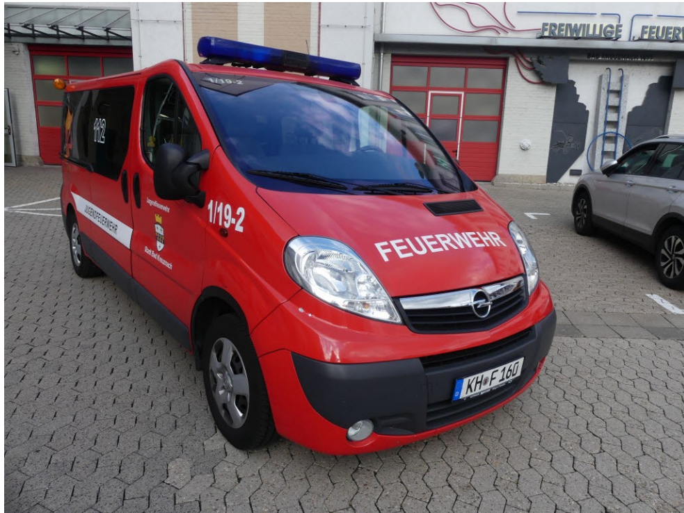
Bild 3 Frontdiagonale rechts