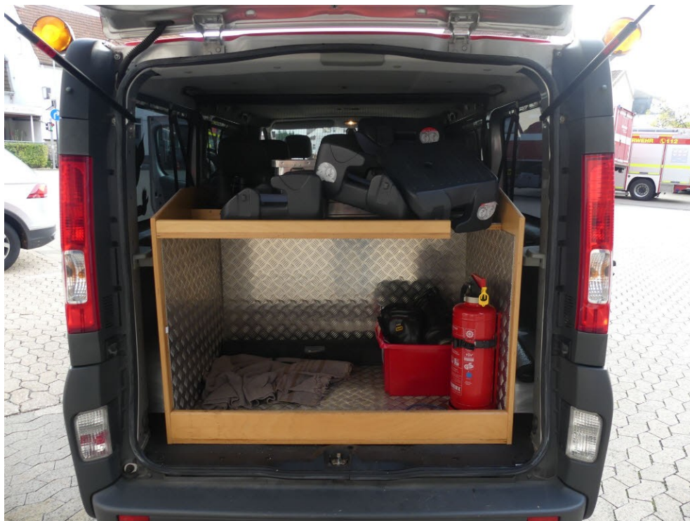
Bild 10 Laderraum