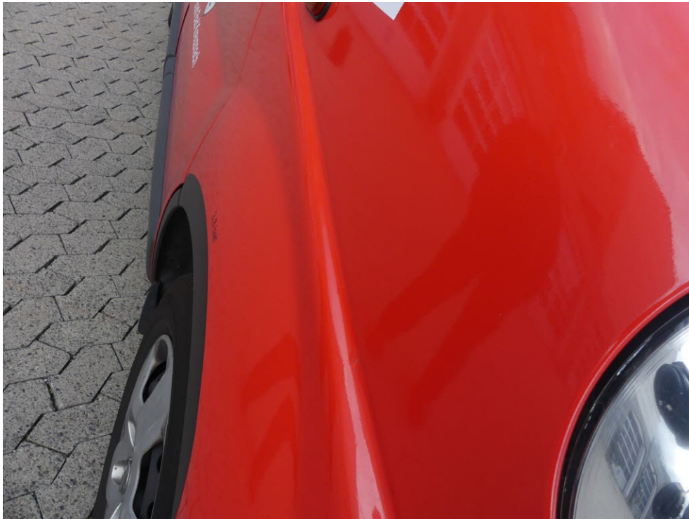
Bild 19 Altschaden