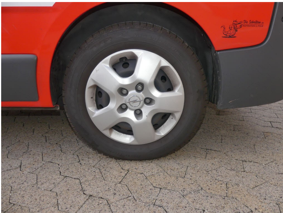
Bild 14 Rad-/Reifenkombination Hinterachse