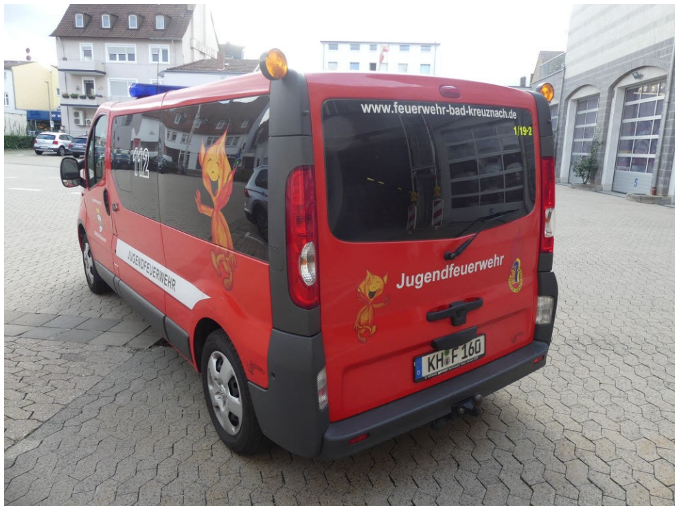
Bild 4 Heckdiagonale links