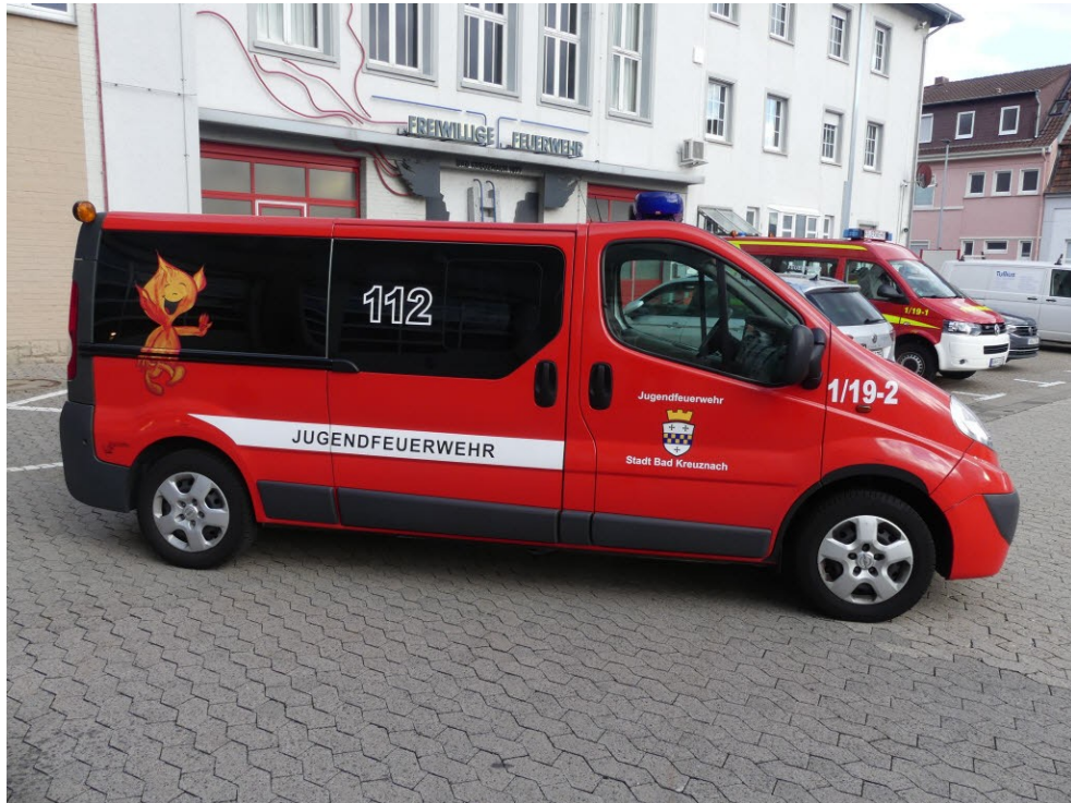
Bild 5 Fahrzeugseite rechts