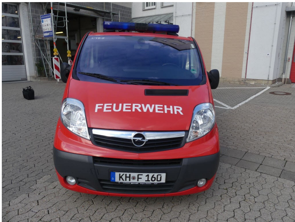
Bild 6 Fahrzeugfront