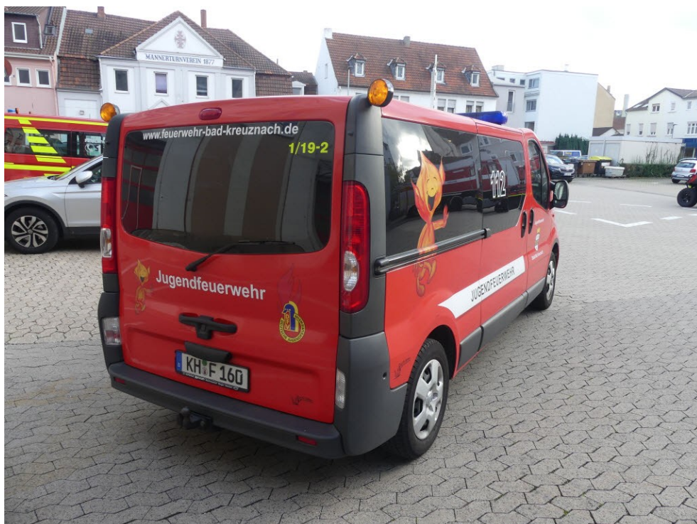
Bild 2 Heckdiagonale rechts