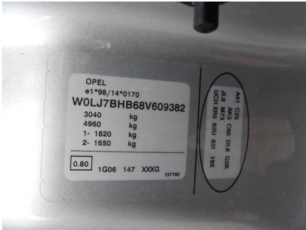
Bild 15 Typenschild