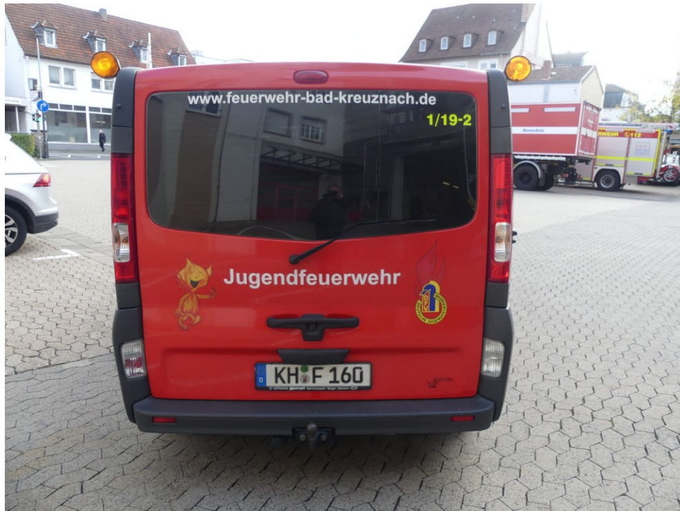
Bild 9 Fahrzeugheck