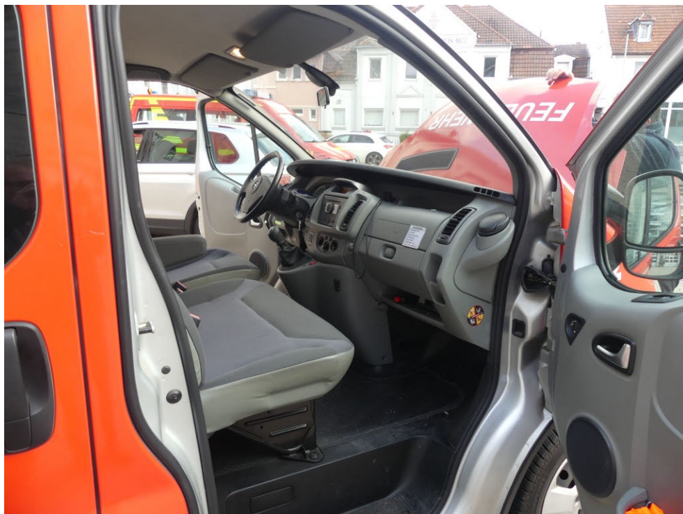
Bild 12 Innenraum vorne rechts