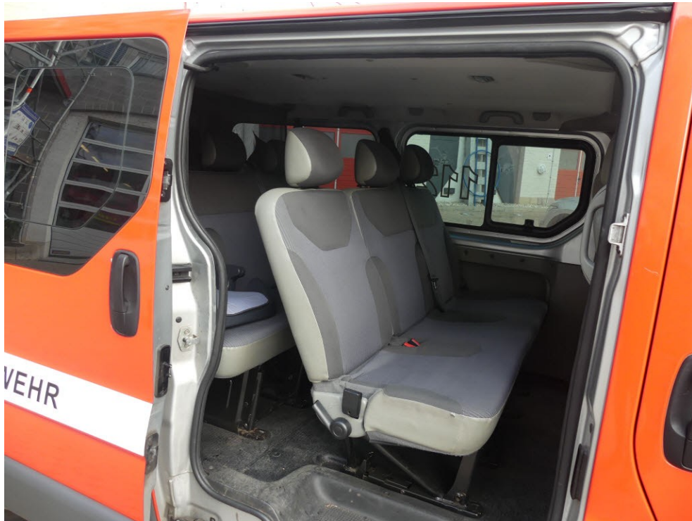
Bild 11 Innenraum hinten rechts