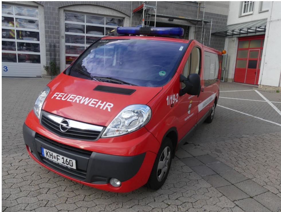
Bild 1 Frontdiagonale links