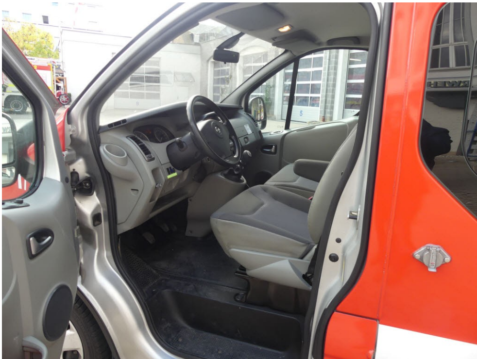
Bild 8 Innenraum vorne links