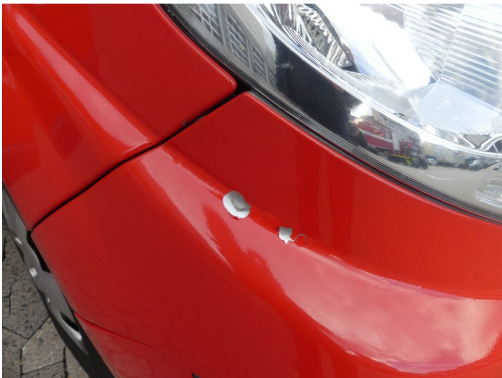
Bild 18 Altschaden