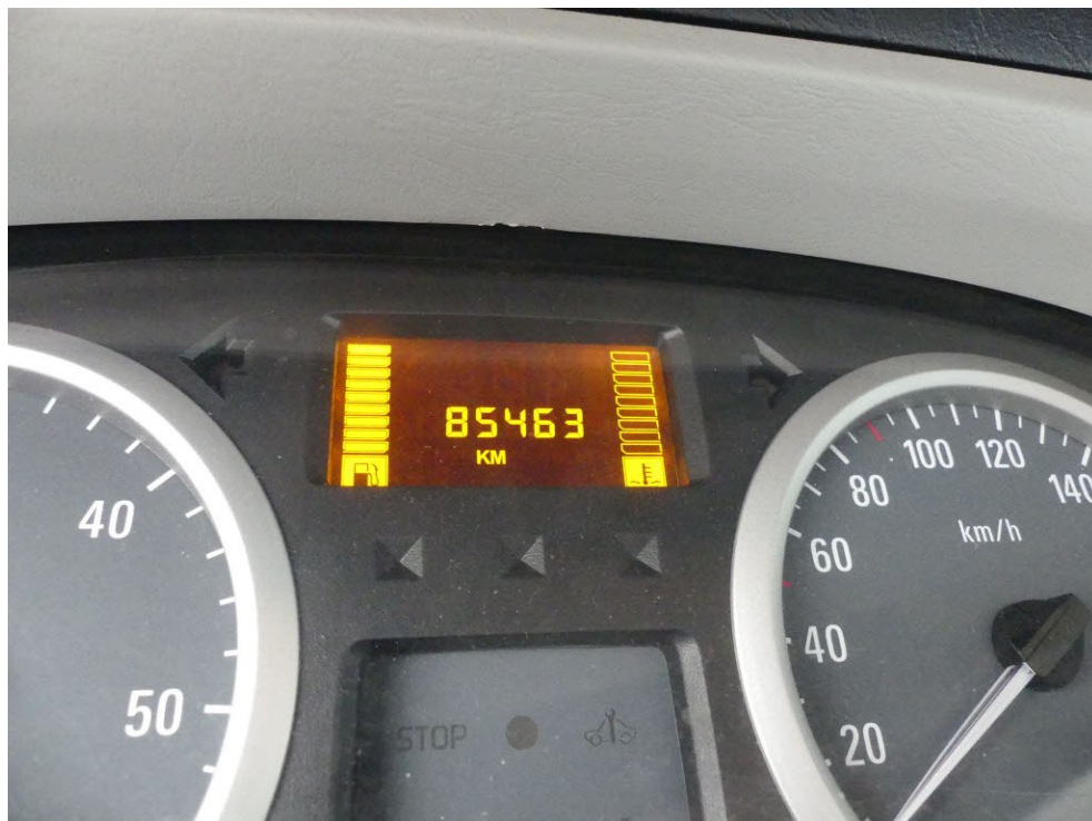
Bild 16 Tacho - Kilometerstand